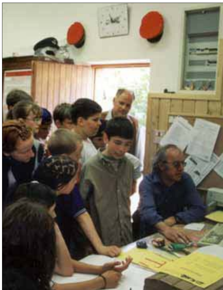
Interessierte Besucher im Club: Schulklasse beim „Tag der offenen Tür“

a salvare molti relitti della vecchia linea, come un segnale ad ala, sbarre, cartelli ecc. Nel 2004 vennero organizzate serate a tema modellistico, dove un esperto insegnava le varie tecniche ai partecipanti, inoltre nel canale radio "Südtirol 1" venne trasmesso un reportage sul club.