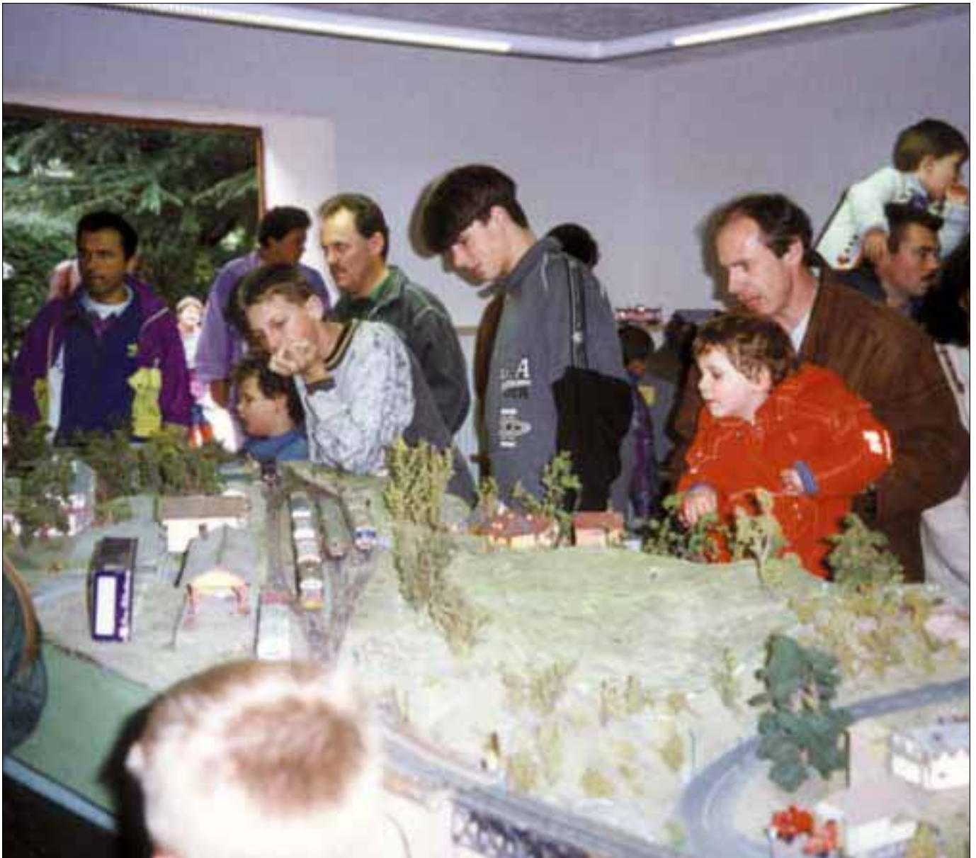
Oktober 1996 - die Clubanlage „Schlanders“ auf der Ausstellung in Rungg Ottobre 1996 - Il plastico sociale „Silandro“ alla mostra a Ronchi