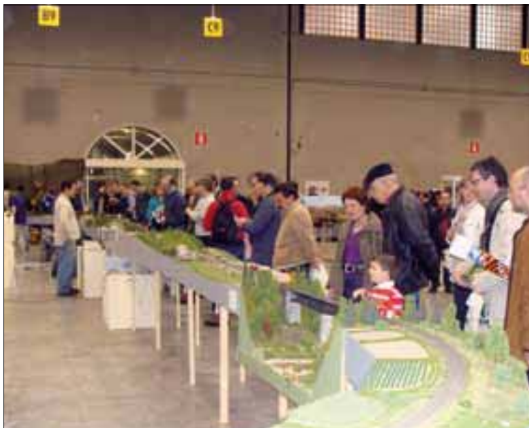
Model Expo Italy 2008 in Verona - über 50.000 Besucher Model Expo Italy 2008 a Verona - più di 50.000 visitatori

Il presidente della provincia Dott. Luis Durnwalder acconsentì il finanziamento di una parte del primo lotto, anche il comune di Silandro si rese disponibile a sostenere una parte dei costi. I restanti costi saranno investiti dal club stesso e appena tutti i finanziamenti saranno definitivamente resi ufficiali si potrà dare inizio ai lavori. Nel 2007 si sentì che a Rablà si era intenzionati a realizzare un museo fermodellistico.