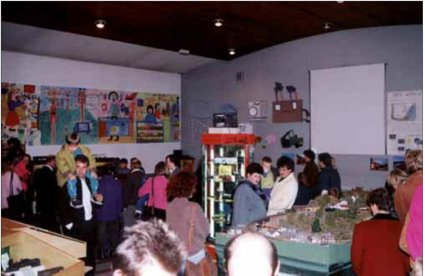
I. Ausstellung des Clubs - 1990 in der Mittelschule Schlanders 1ª mostra del club - nel 1990 nella scuola media di Silandro

entstanden und deshalb mit der Gemeinde Verhandlungen aufgenommen wurden, um größere und geeignetere Räumlichkeiten zu erhalten. Ein mehrseitiger Artikel wurde im Dolomiten-Magazin über die Modelleisenbahntätigkeit in Südtirol abgedruckt, wobei der Club das erste Mal im Rampenlicht der Presse stand.