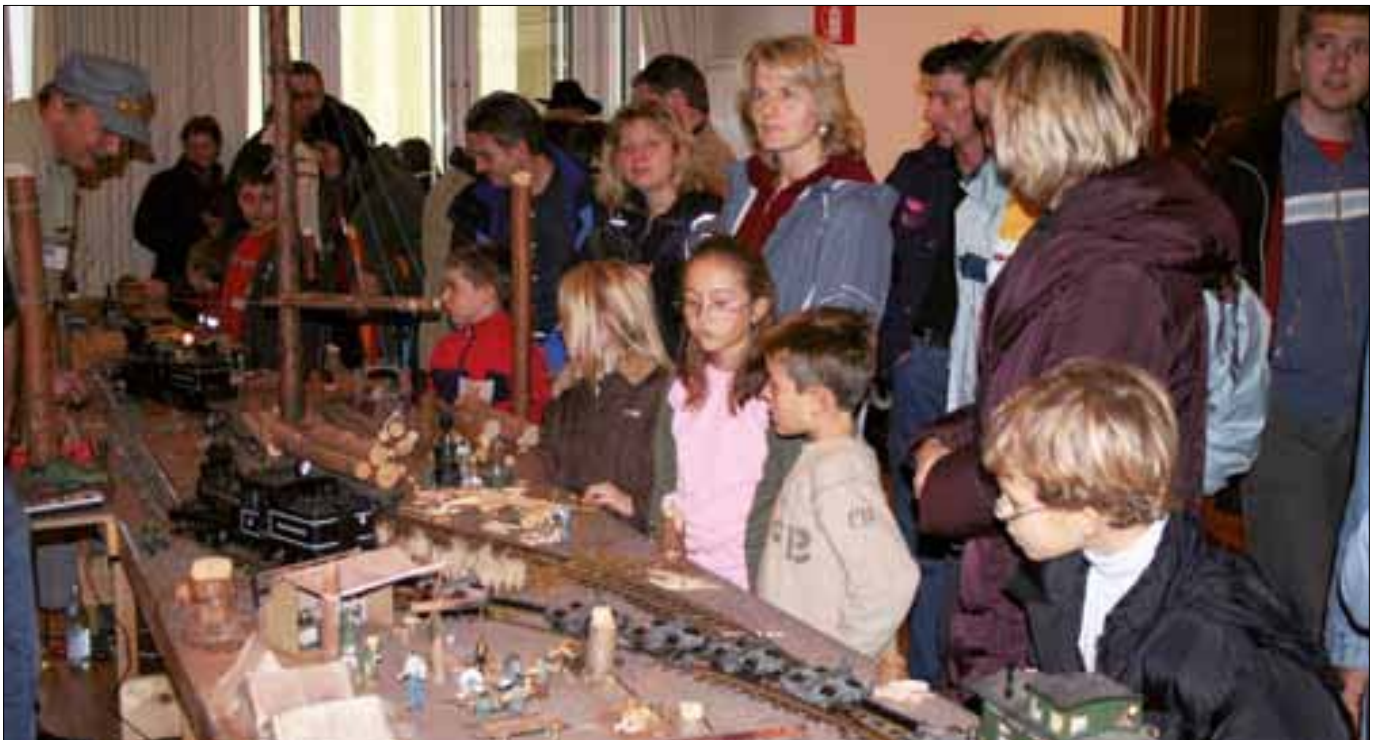
Ausstellung 2005: wiederum ein toller Erfolg Mostra 2005: un grande successo

Nel 2002 si rendeva necessaria una concessione definitiva per l'utilizzo dell'ex magazzino merci come sede del club, siccome giravano voci di un utilizzo per altri scopi (museo, discoteca ecc.). Intanto venne organizzata la mostra a tema delle ferrovie alto atesine, che riscosse di nuovo un gran successo. Continuava anche la realizzazione dei vari plastici del club: modulare Merano-Malles, linea del Brennero e plastico americano. Durante i lavori di ripristino della linea Merano-Malles, il club riuscì