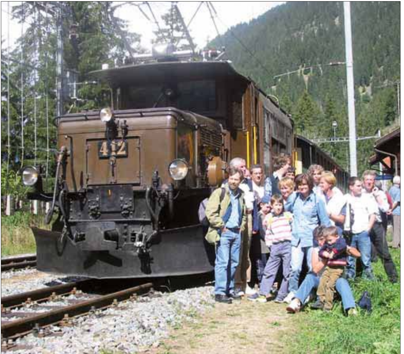
Clubausflug 2003 mit dem Rhätischen Krokodil Gita del club con il "coccodrillo retico" nel 2003