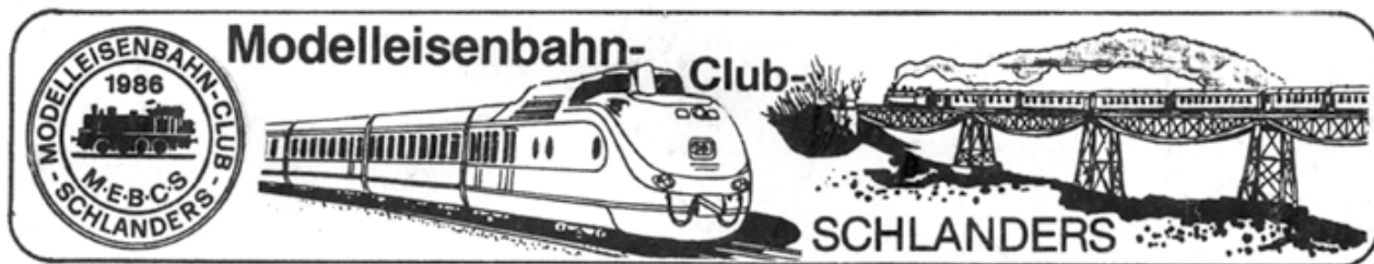
Das erste Logo des Clubs / Il primo logo del club