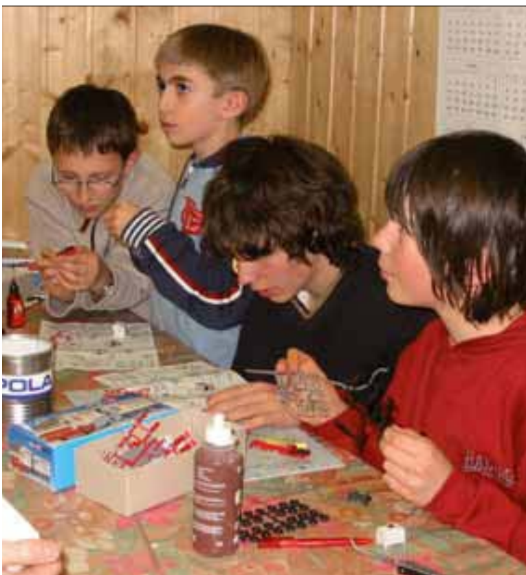
Die Clubjugend beim Modellbauen Il gruppo giovanile durante il montaggio di kit

La mostra internazionale "Ferrovie a Scartamento Ridotto" del 2008 fu nuovamente un grande successo, e per la quale il club iniziò l'organizzazione e la costruzione di plastici già nel 2007. L'evento contò 5.000 visitatori e fu largamente elogiata nelle varie riviste di settore con reportage lunghi fino a 12 pagine. Nel 2009 e 2010 si partecipò alle edizioni del Model Expo Italy a Verona con il plastico modulare della Merano-Malles. In previsione della mostra del 2011 si iniziò l'organizzazione e la realizzazione così come il completamento di plastici e moduli.