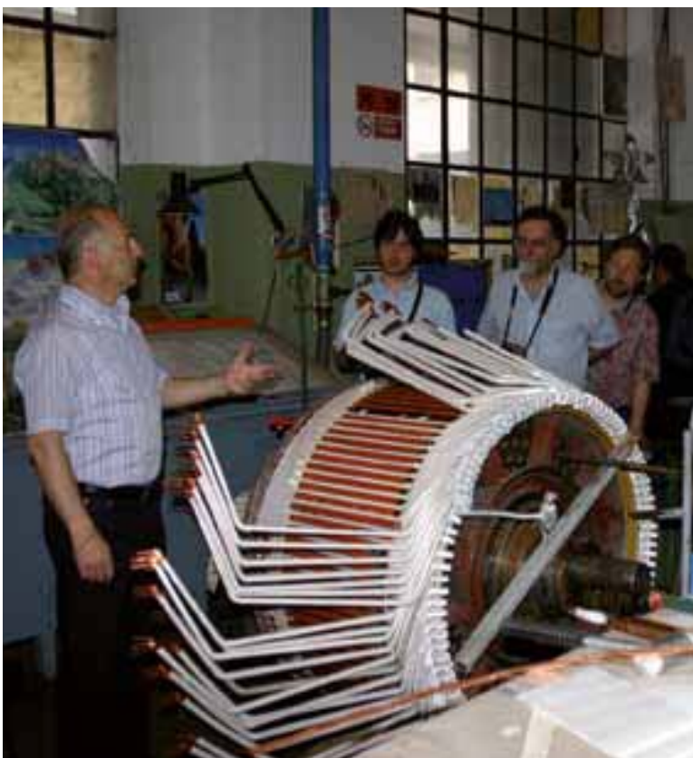
Besuch in der Reparaturwerkstätte der Staatsbahnen in Verona Visita nelle OGR delle FS a Verona

Nach mehreren Aussprachen, Lokalaugenscheinen und Projektänderungen wurde das gesamte Projekt vom Denkmalamt mit einigen Auflagen schlussendlich genehmigt. Auch von der Gemeindebaukommission gab es ein positives Gutachten. Schlussendlich galt es nun, für den auf 188.000 Euro belaufenden Kostenvorschlag einen Finanzierungsplan zu erstellen. Die bereits seit Jahren im Netz stehende Homepage wurde 2005 gänzlich ins italienische übersetzt, und somit konnte ab sofort auch in südlichen Regionen Aktuelles über unseren Club nachgelesen werden. Ein ständiges Problem war auch immer die Lagerung der verschiedenen Module und Dioramen des Clubs. An die 10 verschiedene Lagerplätze gab es im Laufe des Clubbestehens, bis 2005 definitiv im Dachboden der Musikschule, allerdings im 4. Stock, uns von der Gemeinde ein Abstellplatz zur Verfügung gestellt wurde. Anfang Dezember 2006 fand in Verona die Model Expo Italy statt. Mit 10 Modulen der Vinschgerlinie und einigen Dioramen präsentierte sich der Club somit erstmals auf einer italienischen Großveranstaltung und in der italienischen Fachpresse war nur lobenswertes hierüber nachzulesen.