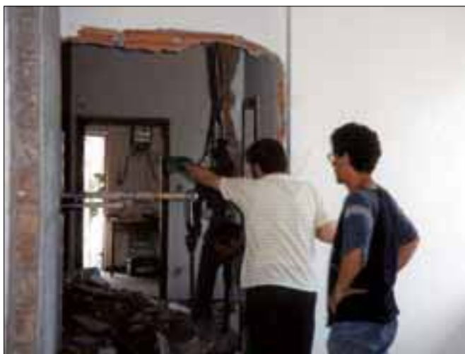
Umbau des Güterschuppen zum Clublokal Trasformazione dell'ex magazzino merci in nuova sede del club

Im März 1997 erhielt der Club eine weitere Kündigung der Räumlichkeiten wegen des anstehenden Abrisses des Zorzihauses. Nach langwierigen Verhandlungen mit der Gemeinde Schlanders wurde eine provisorische Benützungsgenehmigung für den Güterschuppen am Bahnhof Schlanders erreicht. Bis aber diese Räumlichkeiten einigermaßen saniert und eingerichtet waren, investierten die Mitglieder über 1.000 Freizeitstunden und erhebliche Geldmittel. Am 13. Dezember wurden die neuen Clubräume eingeweiht und der Bestimmung übergeben, allerdings immer noch als Provisorium, da das Land die Räumlichkeiten für die Wiederinbetriebnahme der Bahnlinie unter Umständen selbst beanspruchen konnte. Der