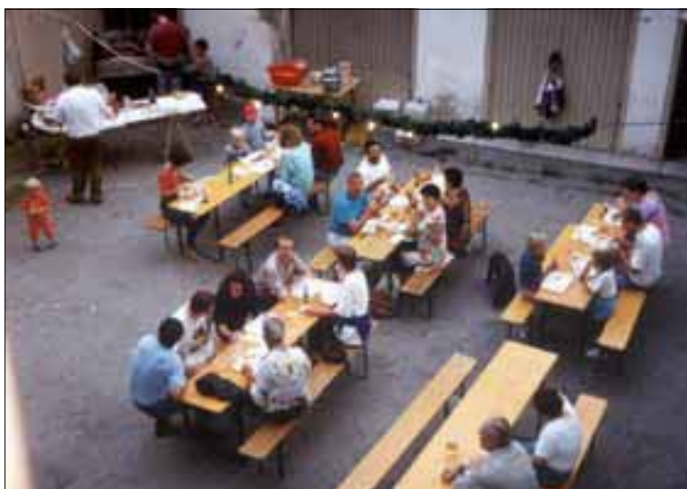
Grillfeier vor dem Clubhaus Nr. 2 - der alten Carabinierikaserne Grigliata davanti all'ex caserma dei Carabinieri - seconda sede del club

Dopo il successo della seconda mostra organizzata a Silandro nel 1992, il club è stato costretto a trasferirsi nella vecchia caserma dei Carabinieri di Silandro, dove sono stati necessari lunghi lavori di adattamento dei locali. Nel 1993 il club ha partecipato alla 3° mostra fermodellistica a Marleno. Nel 1994 ebbe inizio la costruzione del plastico in HO riprodotto la linea del Brennero con la stazione di Campodazzo oggi dismessa. Dopo la partecipazione alla 8° U.S. Convention ad Adliswil (Svizzera) e l'organizzazione della 3° mostra fermodellistica a Silandro, il club dovette nuovamente trasferirsi in un altro locale. Anche i locali della "Casa Zorzi" necessitarono di onerosi lavori di ristrutturazione ed adattamento.