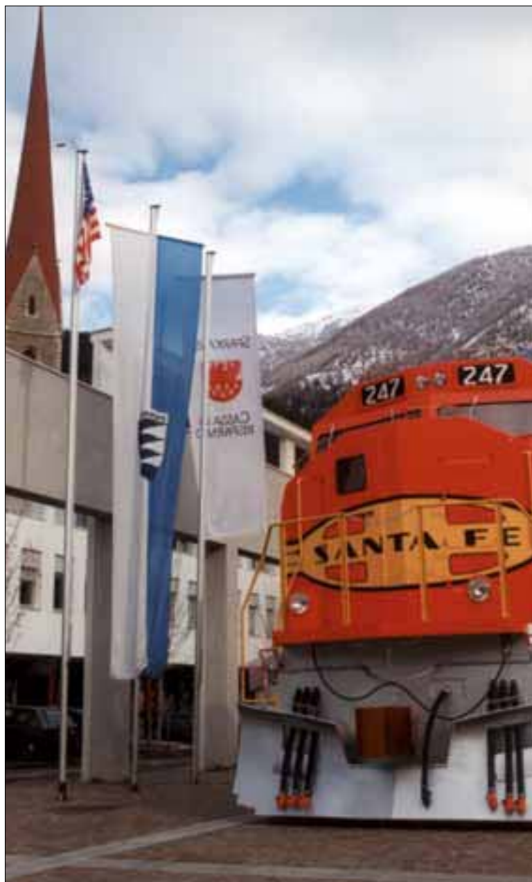
Modellbau Maßstab 1:1-Santa Fe Lok für die Ausstellung 1999