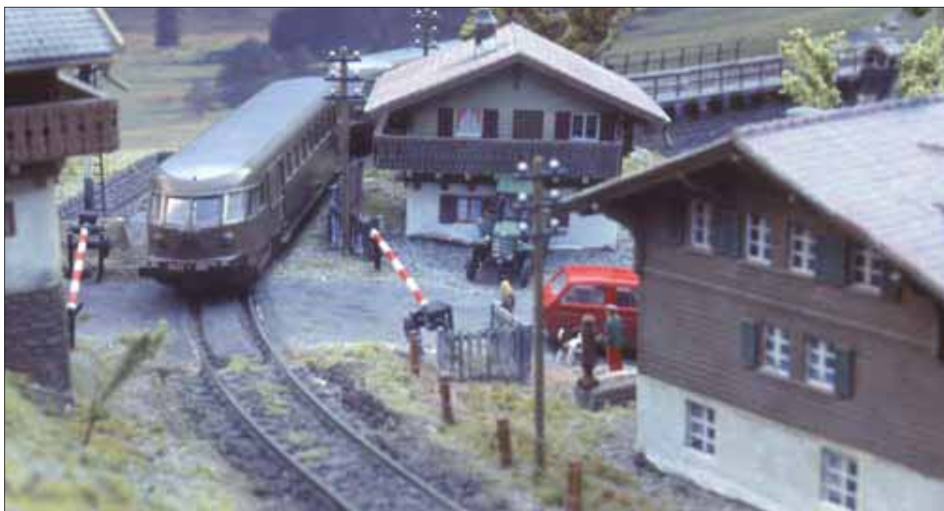
Dorfahrt von Göflan, auf der ersten Clubanlage „Schlanders“ Uscita del paese di Covellano sul primo plastico sociale „Silandro“