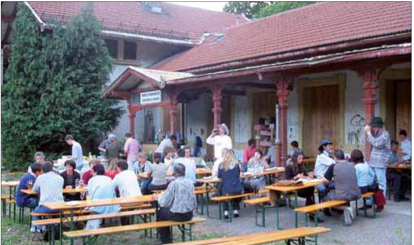
Grillfest vor dem „Bahnhof Schlanders im Dornröschenschlaf“ Grigliata davanti alla stazione di Silandro „in letargo“

contò più di 5.000 visitatori. Nel 2000 cominciò la realizzazione del plastico modulare "Linea Merano - Malles Venosta" e continuò la costruzione del plastico della linea del Brennero con la stazione di Campodazzo. Una documentazione sul club venne mostrata su ORF (canale tv pubblico austriaco). Nel 2001 partì il sito internet www.mecschlanders.com per rendere pubbliche novità, informazioni e storia del club.